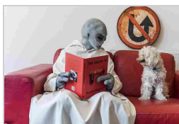
Vittorio Guida, Londra, 2017