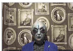
Vittorio Guida, Londra, 2017 © Vittorio Guida